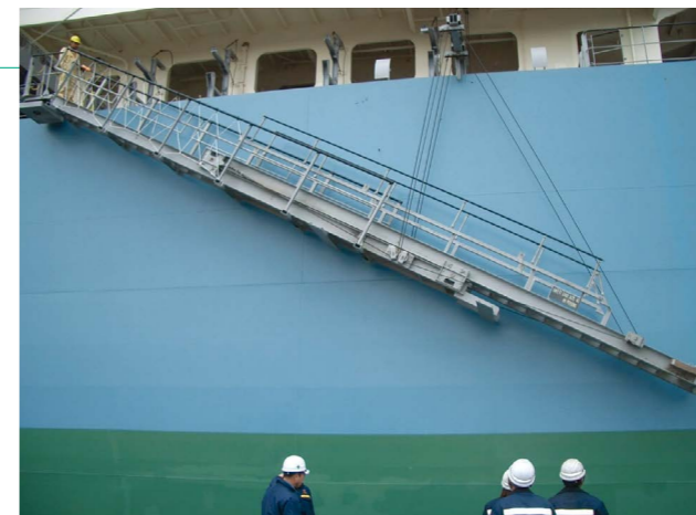
伸縮式垂直格納型舷梯装置

The hoisting, extension and retraction, and stowing operations are all performed automatically at a single press of a button, thus enabling this ladder system to be safely and smoothly stowed in a perpendicular position.