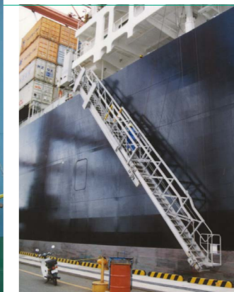
伸縮式水平格納型舷梯装置