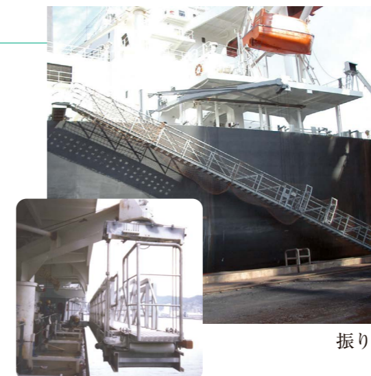
振り出し式水平格納型舷梯装置

This slew-out ladder system is our company's showpiece for safe operation and competitive price.