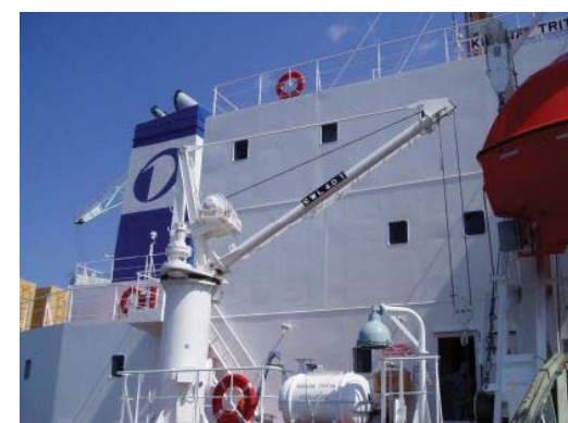
電動式プロビジョンダビット (4TON×5MR) Electric type provision davit