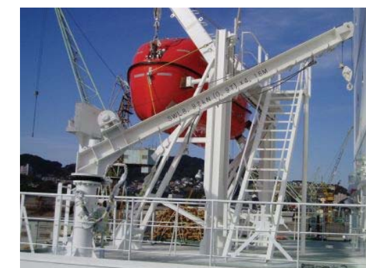
燃料ホース及びプロビジョンハンドリングクレーン (0.9TON×4.15MR) F.O.Hose handling & provision handling crane