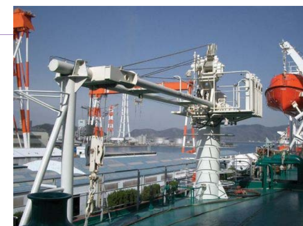
エアー式プロビジョンクレーン (2TON×7MR) Air type provision crane