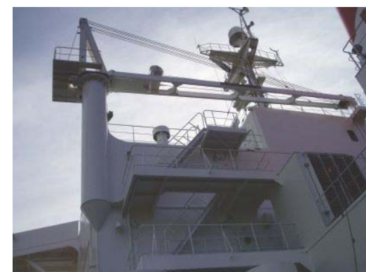
エンジンパーツハンドリングクレーン (4TON×11.5MR) Engine parts handling crane