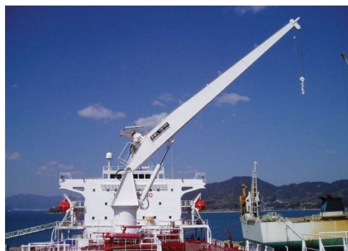
油圧式ホースハンドリングクレーン (10TON×19MR) Hydraulic type hose handling crane