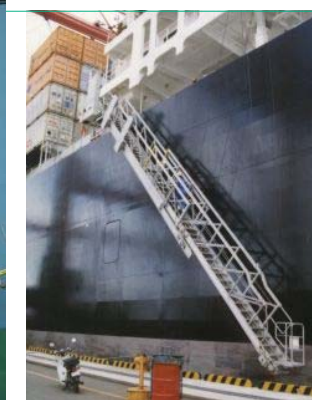
伸縮式水平格納型舷梯装置