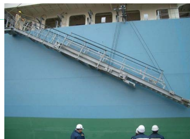
伸縮式垂直格納型舷梯装置

The hoisting, extension and retraction, and stowing operations are all performed automatically at a single press of a button, thus enabling this ladder system to be safely and smoothly stowed in a perpendicular position.