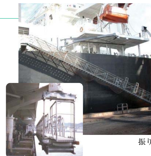
振り出し式水平格納型舷梯装置

This slew-out ladder system is our company's showpiece for safe operation and competitive price.